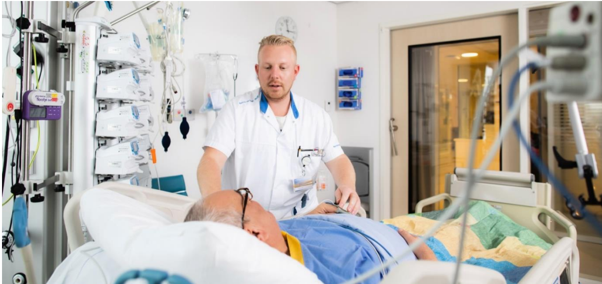
Afbeelding: Intensive Care (IC) kamer

De operatie duurt ongeveer vijf tot zes uur. Daarna wordt u naar de IC (Intensive Care) of PACU (Post Anesthesia Care Unit) gebracht. In de tussentijd worden uw naasten op de hoogte gebracht door de chirurg. Als u wakker wordt bent u aangesloten op verschillende monitoren. Het doel is om zo snel mogelijk, liefst direct na de operatie, de beademingsbuis te verwijderen zodat u die bij het wakker worden niet meer voelt. In overleg met de IC/PACU-verpleegkundige kunt u bezoek ontvangen.