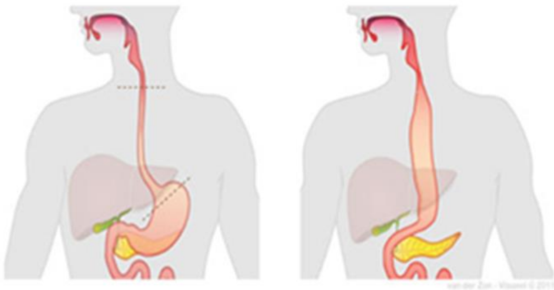
Afbeelding: links oude situatie voor operatie en rechts nieuwe situatie buismaag na operatie

Het is belangrijk om te weten dat na de operatie de inhoud van de maag veel kleiner is geworden. U zult hierom rekening moeten houden met uw voeding. De buismaag zal ook niet direct werken als een slokdarm. Het herstel kan een aantal maanden duren. De meeste mensen lukt het om hiermee een goede kwaliteit van leven te bereiken.